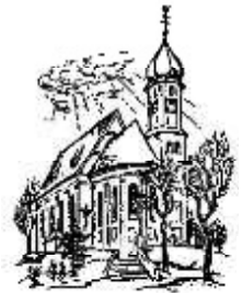
St. Johann Baptist