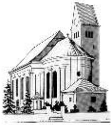
St. Peter u. Paul