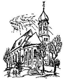
St. Johann Baptist